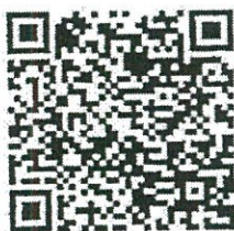
รายละเอียด